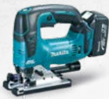
DJV182 Ubodna pila