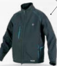
CJ105D Jakna s funkcijom grijanja