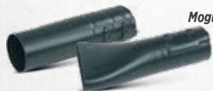
Mogućnost izbora okrugle ili ravne mlaznice