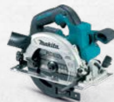
DHS660 Ručna kružna pila