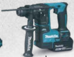
DHR171 Akumulatorska bušilica-čekić