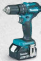
DHP483 Udarna bušilica-odvijač