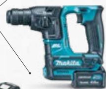
HR166D Akumulatorska bušilica-čekić