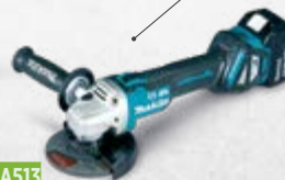
DGA513 Kutna brusilica