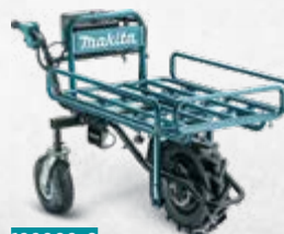
199009-8 Ravni cjevasti okvir