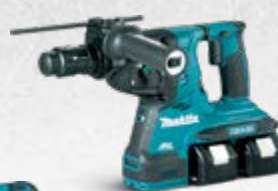
DHR283 Akumulatorska bušilica-čekić