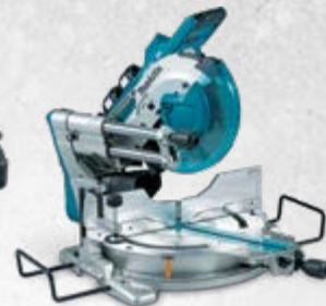
DLS111U Pila za rezanje pod kutom