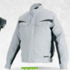
DFJ213 Jakna s ventilatorom