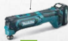
TM30D Multifunkcijski alat