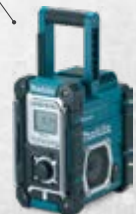
DMR108 Bluetooth radio