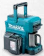
DCM501 Aparat za kavu