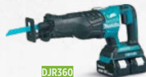
DJR360 Recipročna pila