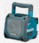
DMR202 Bluetooth zvučnik